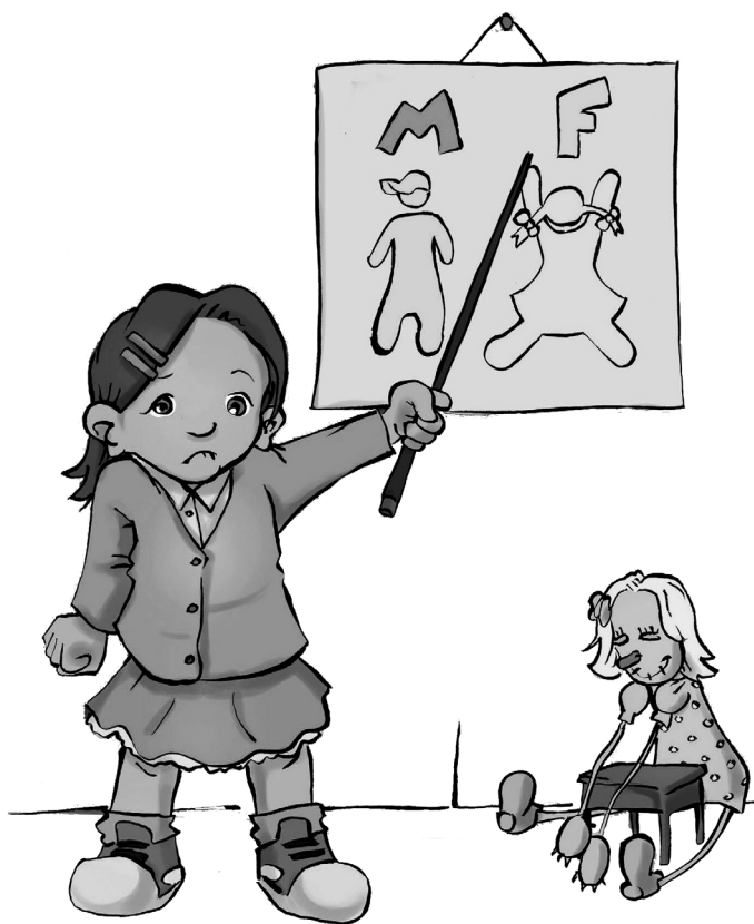
Illustration: Sophie Labelle